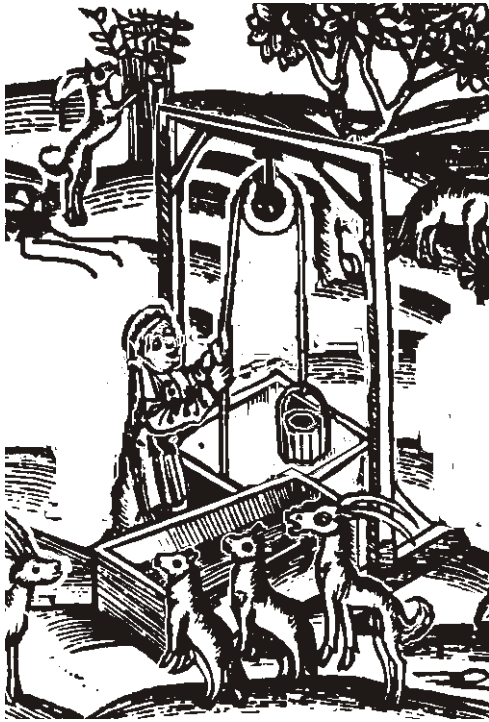
Gravure du XVIIe siècle. In l'histoire de la France rurale